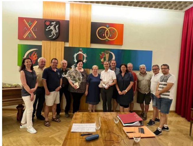
(Foto: Franziska Pieber mit unseren Gemeinderäten, Bürgermeister LAbg.Mag.Dr. Dolesch und Amtsleitung Spirek E.)

Mit dem Ruhestand beginnt eine Zeit voller Freiheit, Genuss und neuen Möglichkeiten und dafür wünschen wir alles Gute!